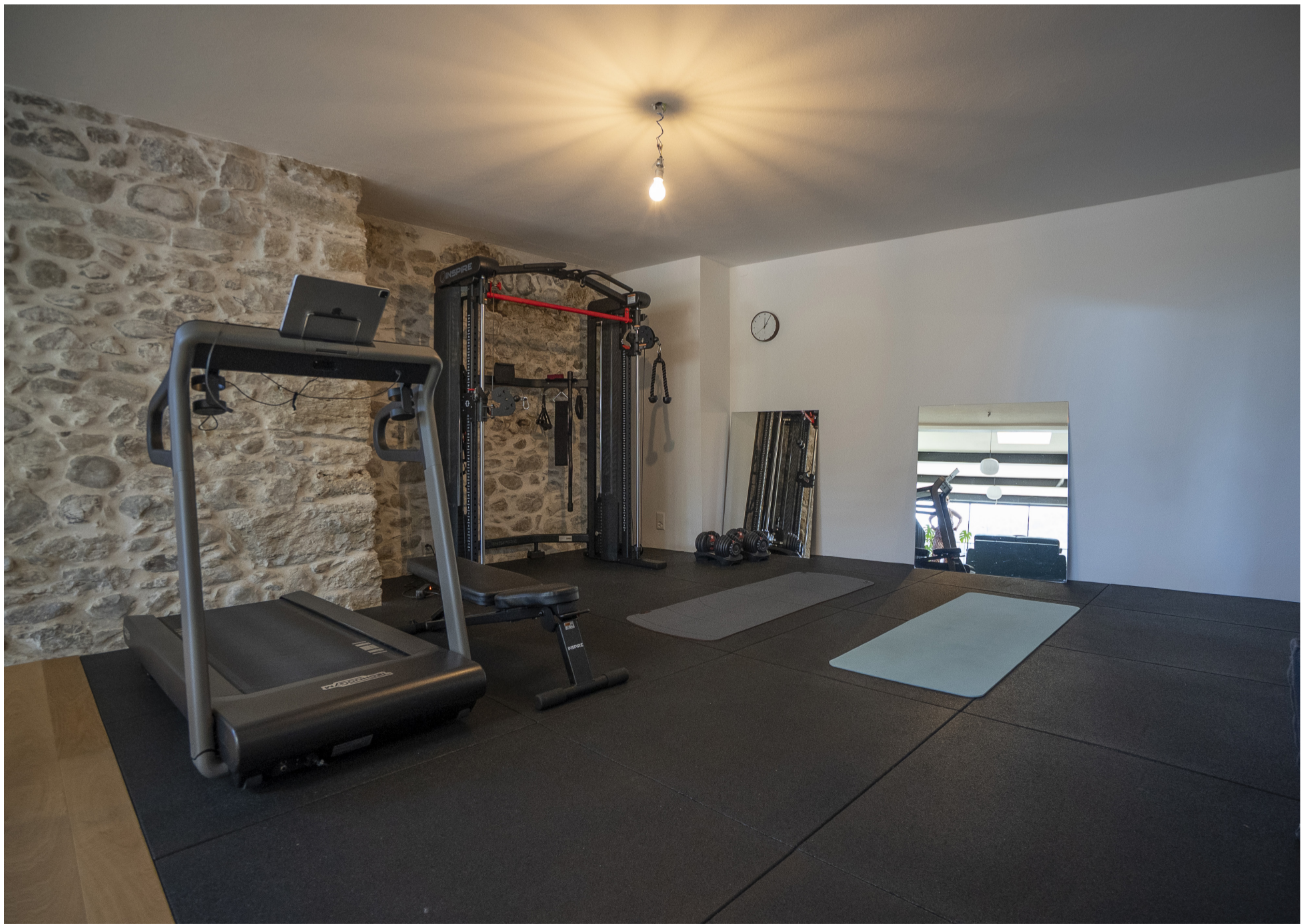
Salle de Fitness