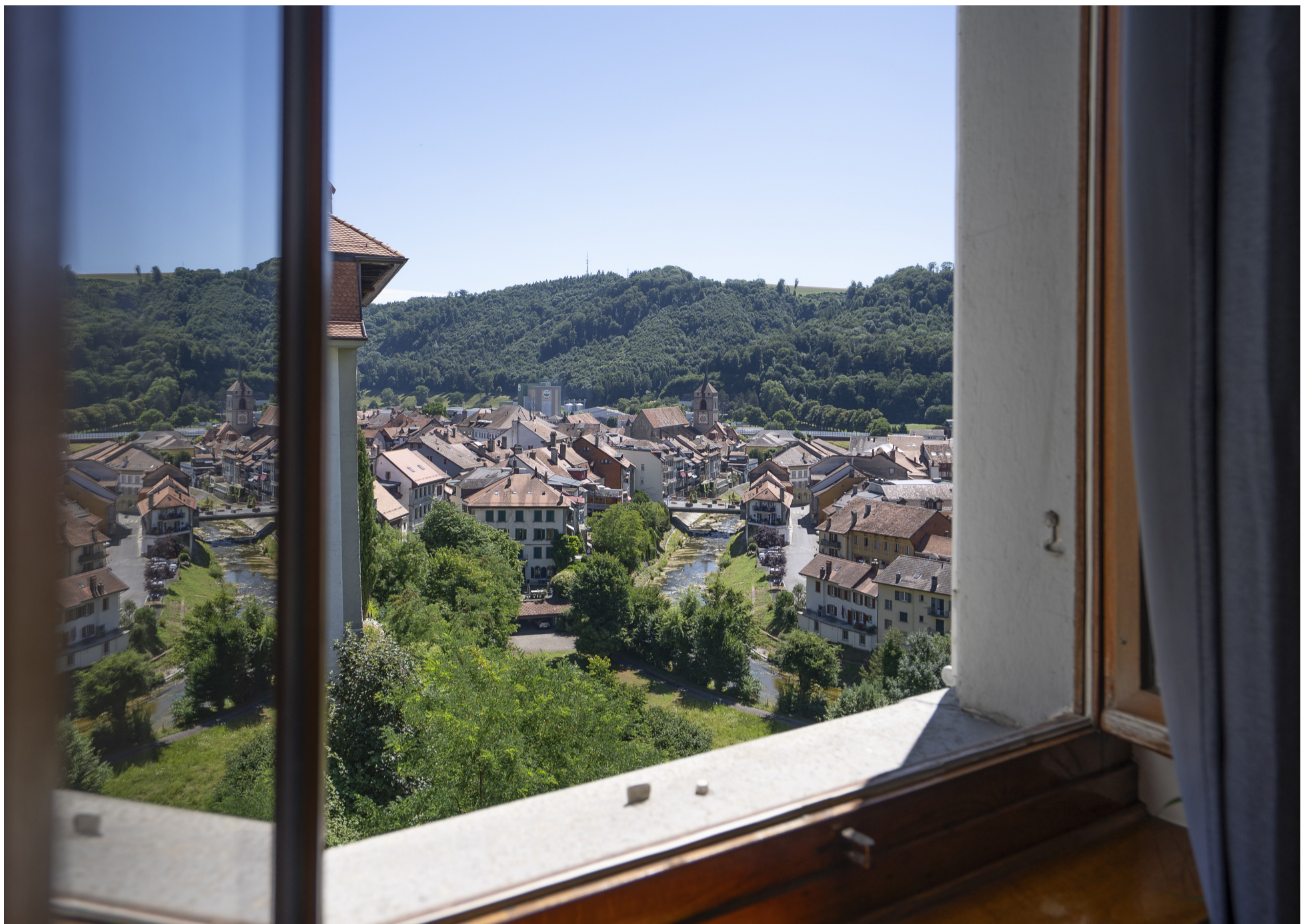
Vue village Broye