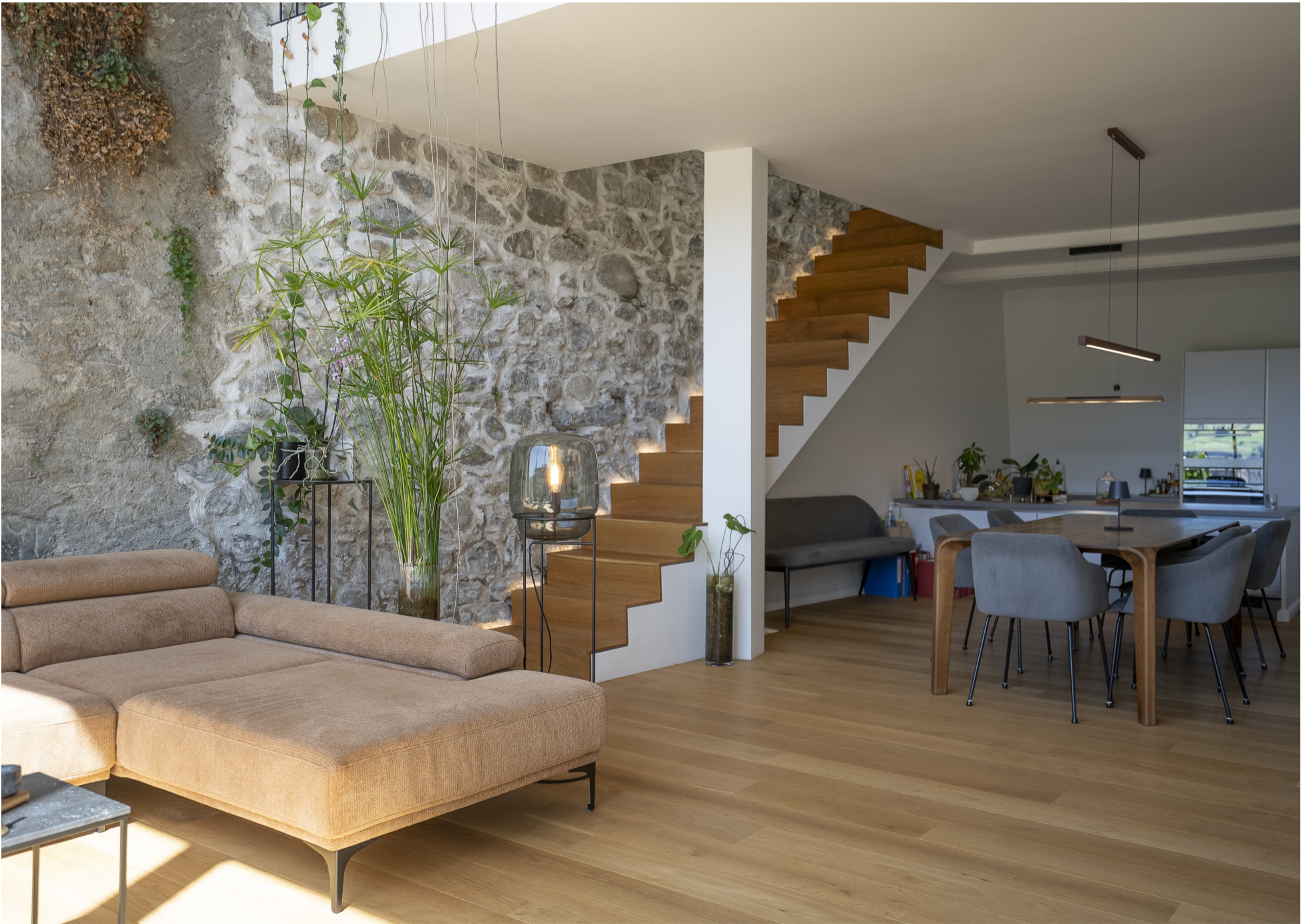
Salle a manger