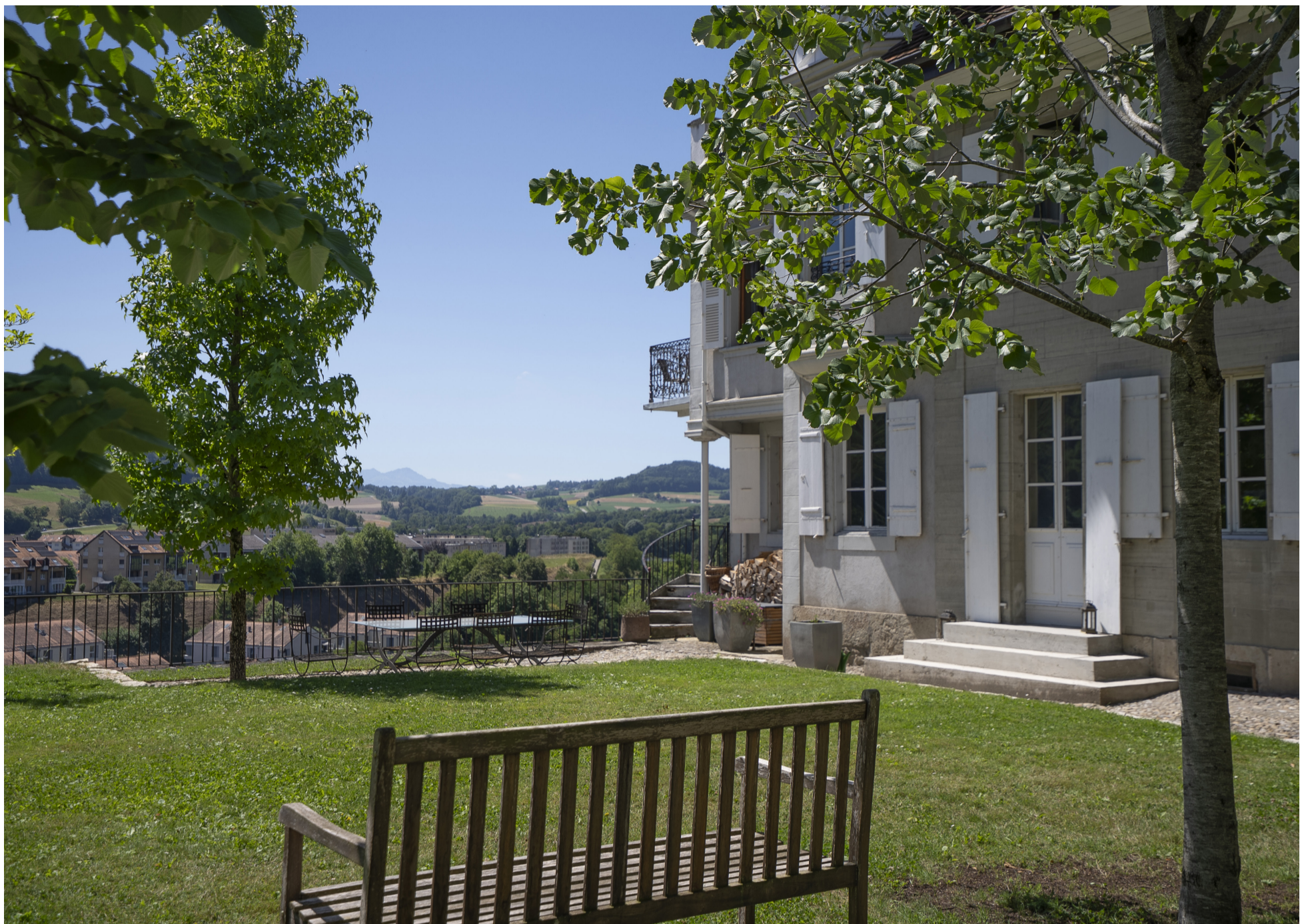
Jardin vue sud alpes